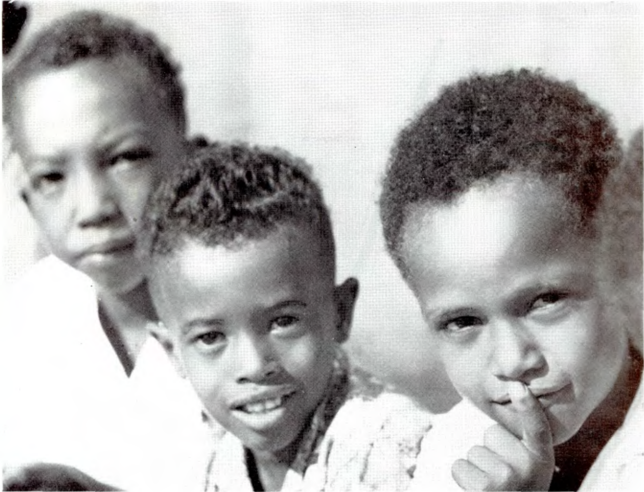
Minois enfantins The facial expressions of children Caras infantiles

la jeunesse malgache nous avons pu voir briller aux plus hauts rangs du gouvernement, de l'église et de l'administration, des Anciens pleinement conscients de leurs responsabilités et décidés à les assumer dans la foi et la fidélité.