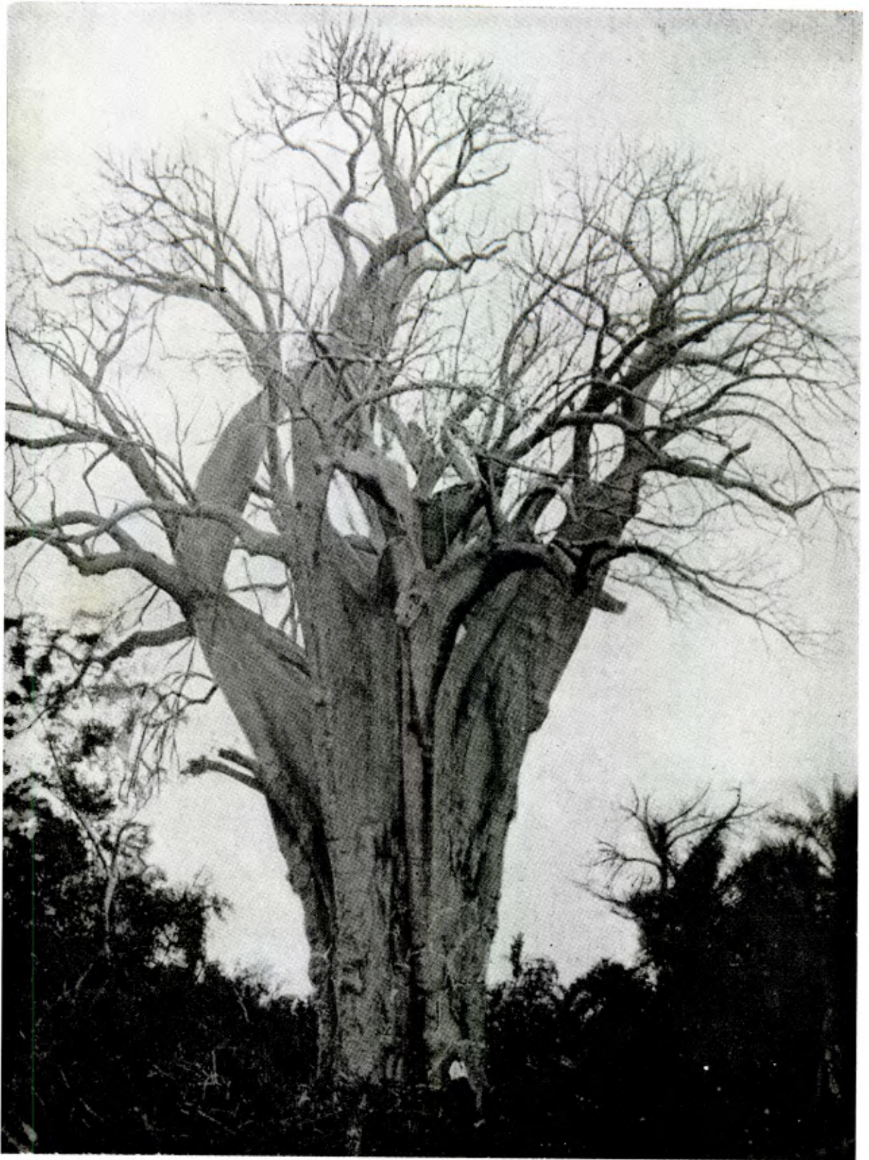
Baobab, en forêt madécasse