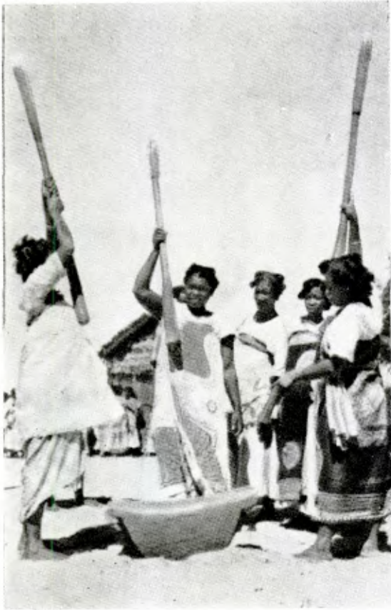
Danses malgaches Malagasy executing a danse Bailes malgachos