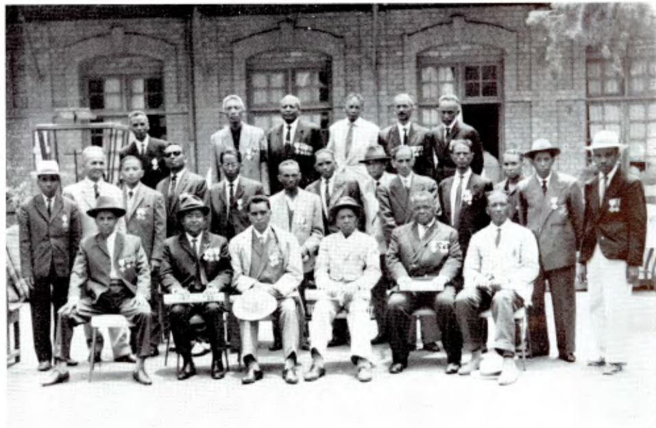
Enseignants chrétiens nouvellement décorés

● Décorations ecclésiastiques et officielles sont remises: officiers et chevaliers Pro Deo et Ecclesia ; médailles Bene merenti , d'une part; médailles de l' Ordre national malgache , de l'autre.