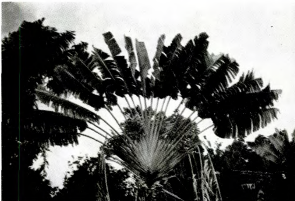
Le Ravenala, arbre des voyageurs: providence, au milieu de la forêt malgache

The Ravenala, the traveler's tree: providence in the midst of a Madagascar forest