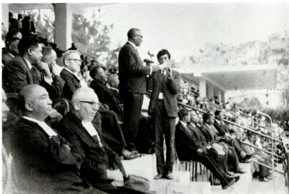
Discours de M. Le Ministre délégué

Mesdames et Messieurs, la solennité à laquelle nous prenons part est de celles qui honorent l'humanité. Célébrer la mémoire des grands hommes, des hommes utiles qui travaillèrent à édifier la grandeur et la prospérité de notre pays, constitue un acte de reconnaissance et de légitime fierté.