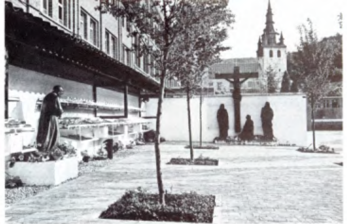
MALONNE (Belgique): Le calvaire et la statue du Frère Mutien-Marie.