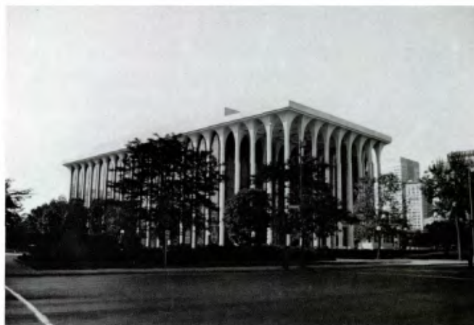
SANTA FE (New Mexico): La bibliothèque du College de Santa Fe.