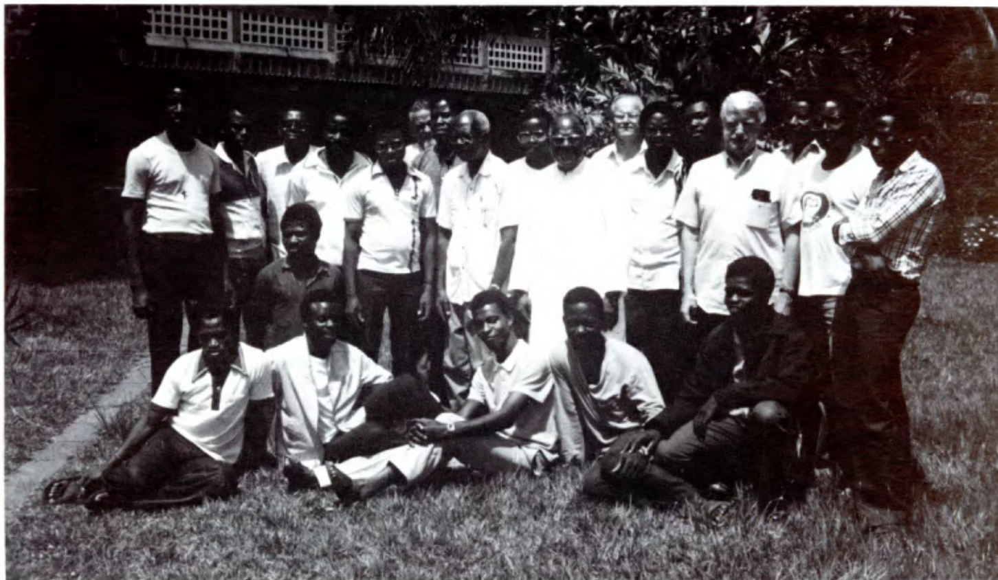
KINSHASA (Zaïre): Les novices de 1987 avec leurs formateurs.

La RELAF fait face à des difficultés réelles d'ordre géographique et d'ordre culturel. Mais il n'y a pas que des difficultés: il y a aussi des éléments communs qui unissent et qui rassemblent. Grâce à ces éléments communs la RELAF non seulement a survécu, mais encore elle a mis en place des services communs; elle s'est donné une structure souple et pouvant évoluer. Tout ceci a contribué à renforcer l'unité de la RELAF, au bénéfice des districts, sous-districts, délégations et secteurs qui la composent.