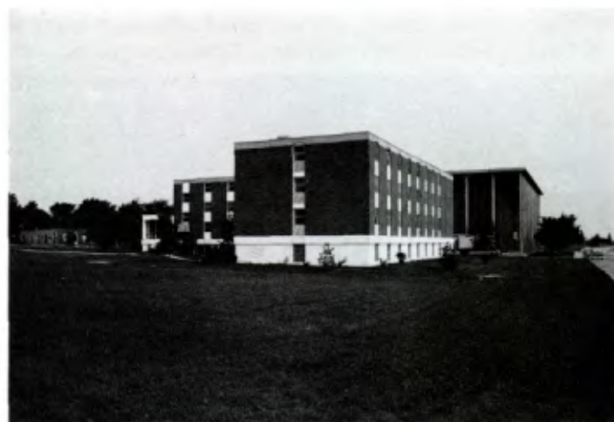
ROMEOVILLE (Illinois): Lewis University, le bâtiment central.