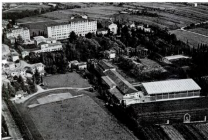
PADERNO DEL GRAPPA (Italie): Vue d'ensemble des «Istituti Filippin».

★ Le rôle de Commissions de Région est exercé par les Commissions des Districts agissant en étroite collaboration pour étudier et appliquer des programmes communs.