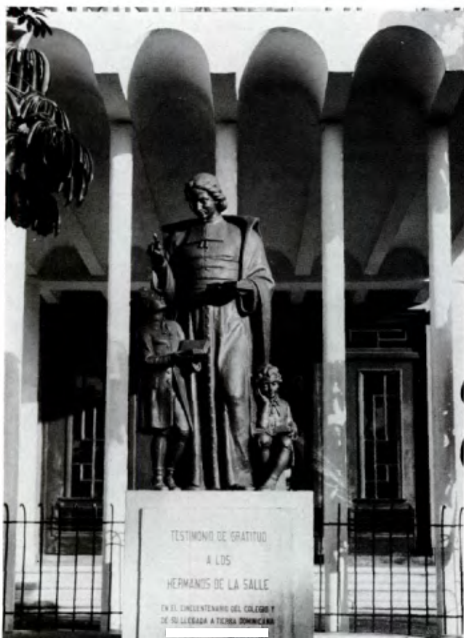
SANTO DOMINGO (Republica Dominicana): la statue de Saint Jean-Baptiste de La Salle à l'entrée du Colegio Dominicano De La Salle.