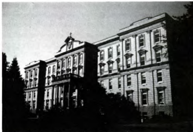
WINONA (Minnesota): Façade de Saint Mary's College.

4. Il y a 14 écoles d'éducation spéciale s'occupant de jeunes qui ont été reconnus délinquants par les tribunaux ou abandonnés par leur famille ou perturbés sentimentalement ou ayant des pro-