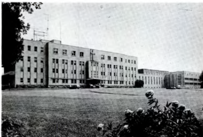
STE-ANGÈLE DE LAVAL (Canada): Ecole secondaire Mont-Bénilde.