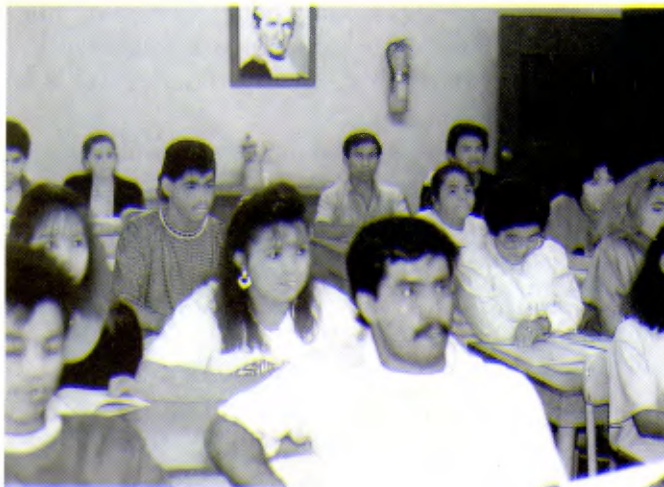
TIJUANA (MEXIQUE): Une classe du centre de formation intégrale.

«Une expérience évangélique», dit Mgr l'Evêque. 60 cours différents y sont donnés, en harmonie avec le plan pastoral diocésain.