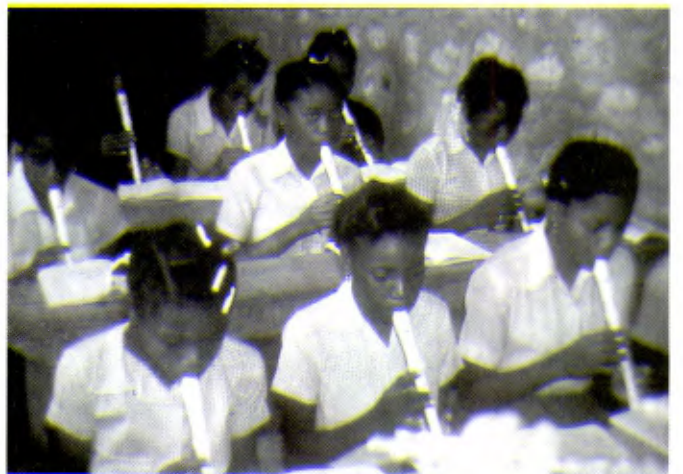
HAÏTI: Ces Haïtiennes apprennent à jouer de la flûte.