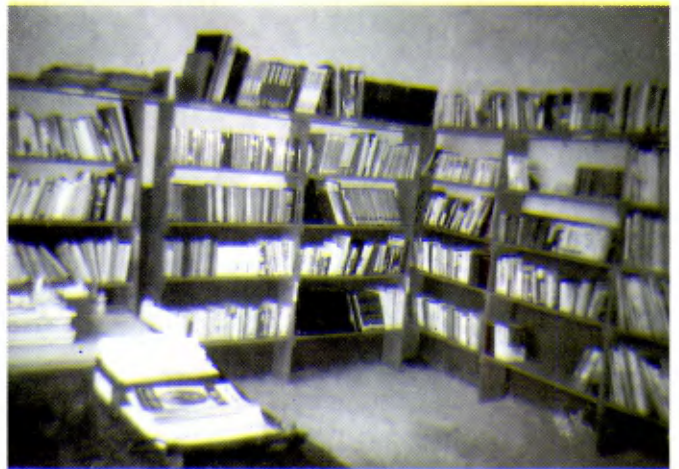
HAÏTI: Une bibliothèque rudimentaire, mais appréciée par les moniteurs.