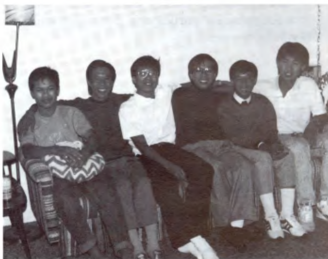
TROIS-RIVIÈRES (CANADA): Un groupe d'immigrés asiatiques qui suivent le programme d'alphabétisation.