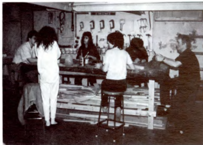
MONTREAL: Une activité de soutien scolaire (programme REVDEC).

— Programme des ateliers: pour donner aux jeunes la possibilité d'apprendre autrement et agréable-