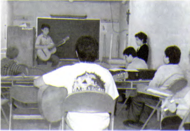
En Amérique du Nord, le problème de l'accueil et de l'alphabétisation des immigrants est particulièrement aigu. De nombreuses initiatives ont été lancées par des lasalliens près de la frontière entre les Etats-Unis et le Mexique.