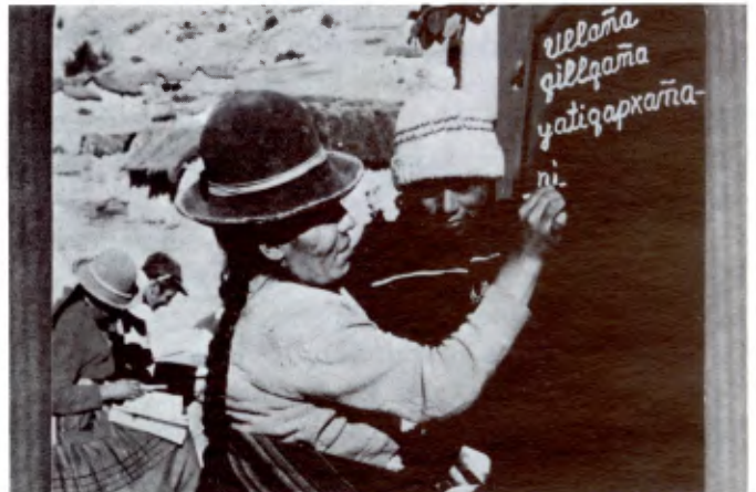
AYAHUALULCO: Une vieille indienne apprend à lire.