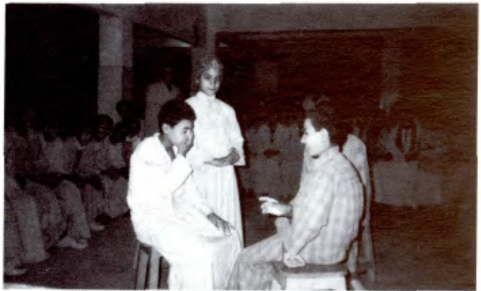
BAYADEYA (EGYPTE): Un sketch joué par les enfants au cours d'une petite fête de l'alphabétisation.