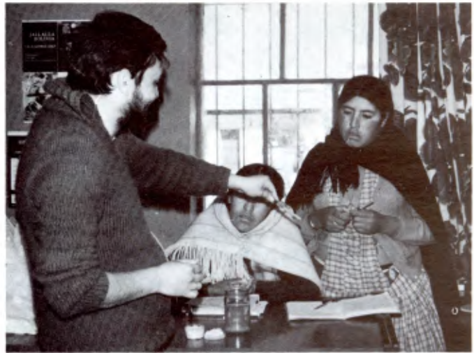
AYAHUALULCO (MEXIQUE): Aide aux paysans des montagnes de Veracruz.

• Tout le travail accompli est bénévole, et le financement se fait grâce aux dons des bienfaiteurs et surtout aux apports des Frères des Ecoles Chrétiennes du Mexique.