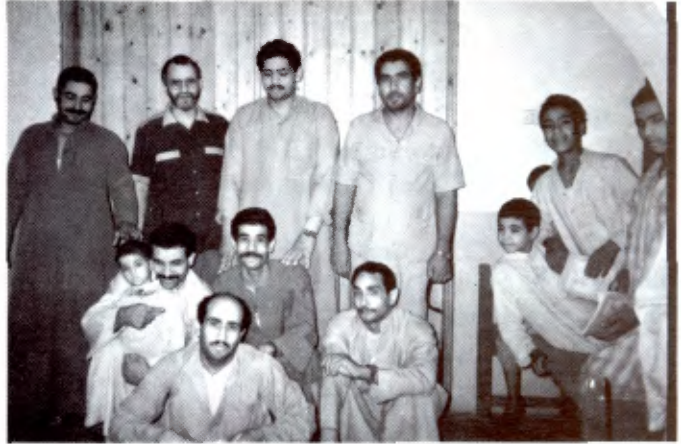
BAYADEYA (EGYPTE): L'équipe de moniteurs.

— Les moniteurs sont du village. Des rencontres régulières permettent de faire le point. Ils participent à des sessions de formation organisées par l'ACHE.