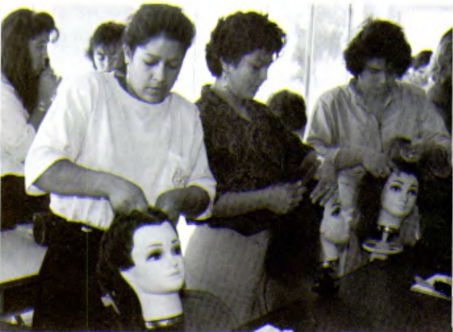
TIJUANA (MEXIQUE): Un cours de préparation professionnelle pour coiffeuses.