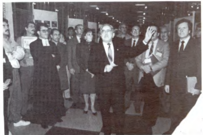
BOGOTÁ (COLOMBIE): Une exposition de documents organisée dans le cadre du centenaire de la présence lasallienne en Colombie.

— Les frais sont payés par les élèves, qui organisent des «loteries» ou des fêtes pour subvenir au financement de toutes ces activités.