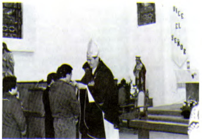
TIJUANA (MEXIQUE): L'éducation religieuse accorde une priorité à la formation et à la maturation de la personne. C'est donc l'une des principales préoccupations des centres lasalliens.