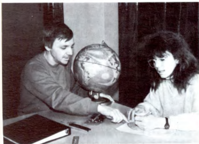
L'aide à une jeune élève en difficulté scolaire.

ment et d'exploiter leurs talents, pour acquérir des habiletés et pour travailler à leur propre rythme.