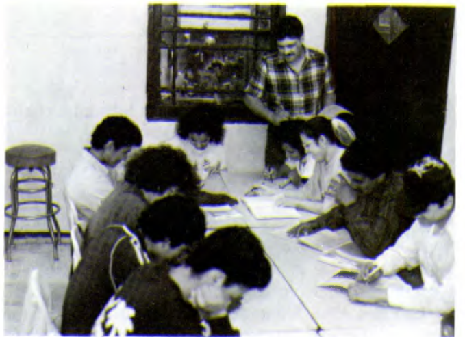
Une classe d'alphabétisation d'adultes.