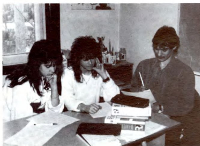
MONTREAL: Aide scolaire (REVDEC).