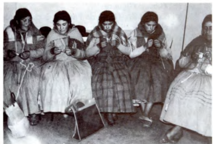
AYAHUALULCO: Leçon de couture pour les indiennes de la montagne.