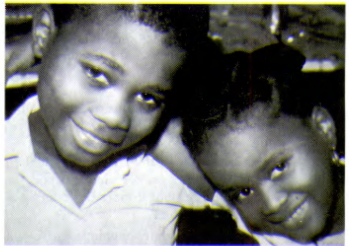
HAÏTI: Deux enfants heureux de s'instruire.

— Chacune des 6 écoles presbytérales de l'île a des classes pour analphabètes regroupant ainsi 1439 élèves, sous la responsabilité du Fr. Bruno Blondeau.