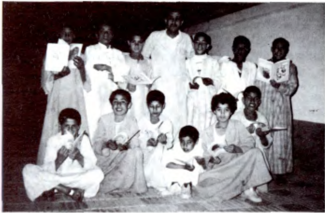
BAYADEYA (EGYPTE): Un groupe d'alphabétisation avec son moniteur.