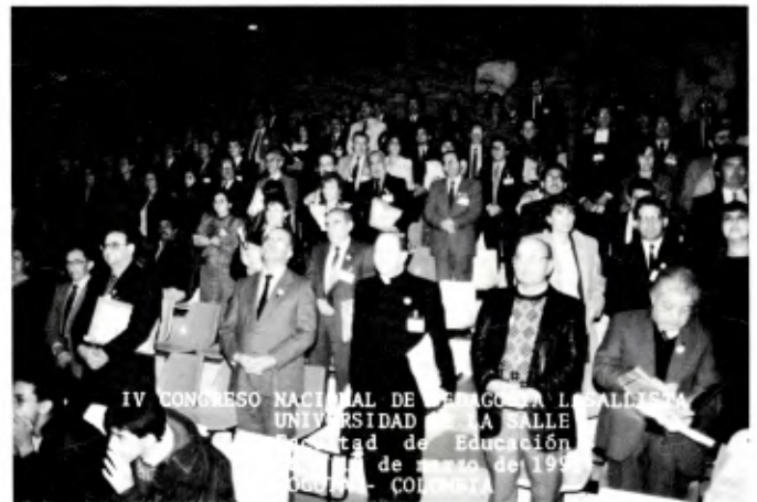
BOGOTÁ (COLOMBIE): Un moment du 4 e Congrès national de pédagogie lasallienne, organisé à la Faculté de Pédagogie de l'Université La Salle en mars 1991.

Ces groupes de jeunes exercent une action sociale en participant à l'organisation et à la réalisation de diverses manifestations ou activités communautaires, de même qu'à celles organisées par l'établissement, sans oublier leur présence active permanente dans le cadre de leurs foyers respectifs ou de leur voisinage.