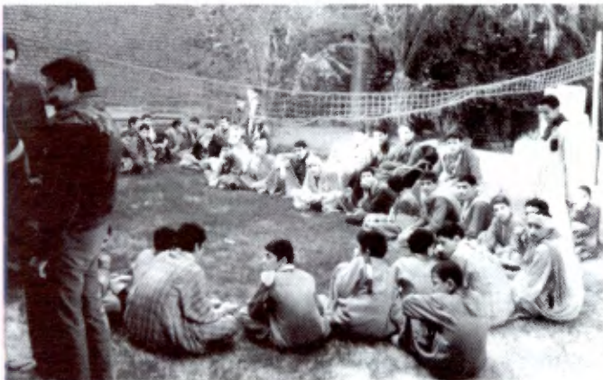
BAYADEYA (EGYPTE): Un groupe d'alphabétisation en promenade à Akkim.

— La méthode suivie a été élaborée par un comité oecuménique. Elle s'inspire largement de la méthode de Paulo Freire au Brésil. Elle insiste sur les centres d'intérêt, la réflexion et le dialogue.