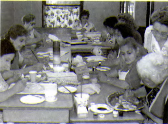
TIJUANA (MEXIQUE): Les initiatives visant l'éducation de base et la formation professionnelle sont obligatoirement très diversifiées en fonction des personnes et du travail susceptible de mieux les insérer dans la société.