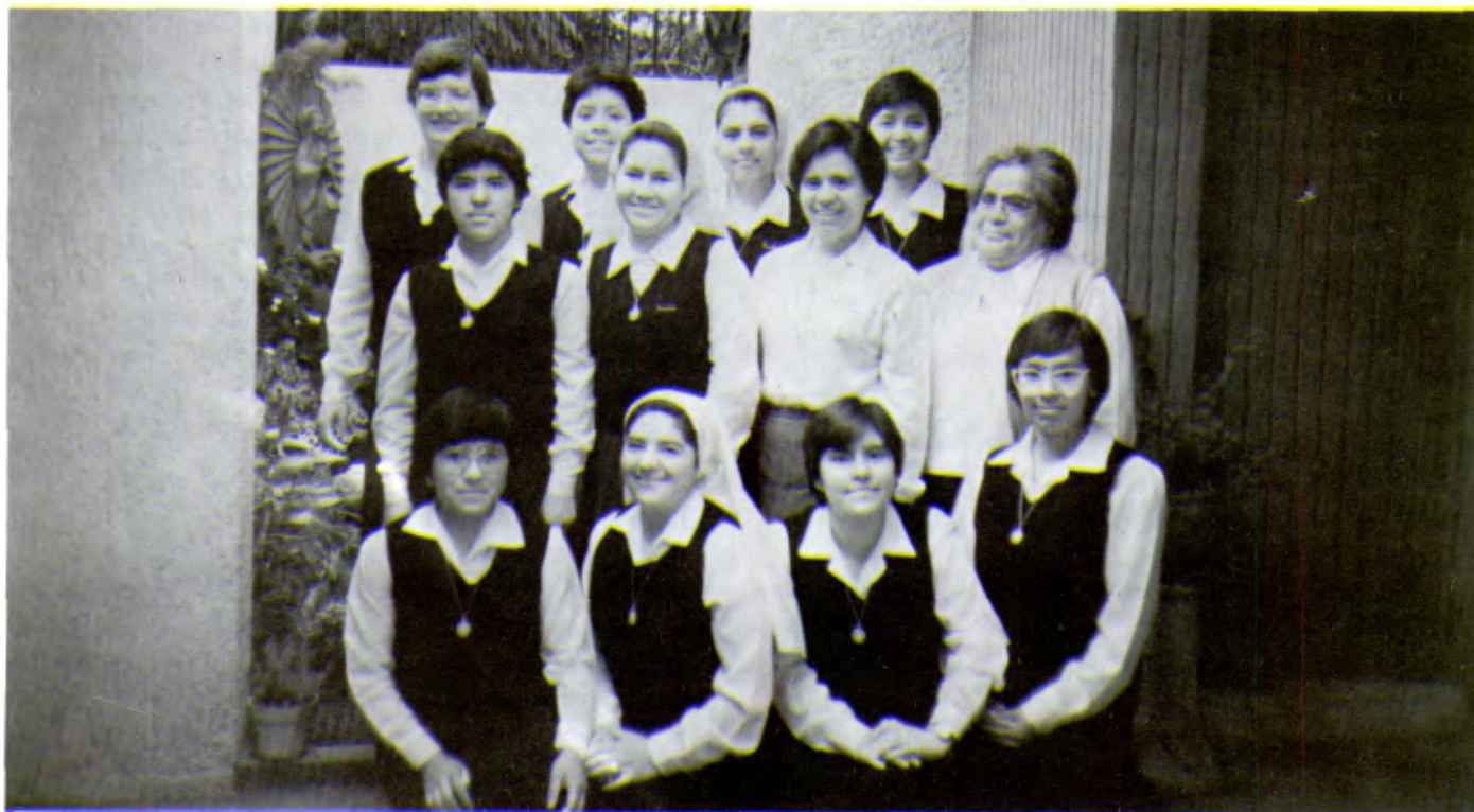
Les Soeurs Guadeloupaines de La Salle s'engagent de plus en plus dans le domaine scolaire et éducatif. Nous voyons ici un groupe de jeunes Soeurs en formation.