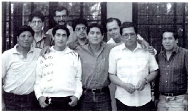
Perú: Equipo de Pastoral del Distrito. Falta el fotógrafo, el Hno. Manuel Olivé.

En el Colegio La Salle de Lima funcionan 11 grupos de Escuela de Padres. El curso consta de 21 lecciones, que se imparten los miércoles y los jueves, de 7 a 8 de la tarde.