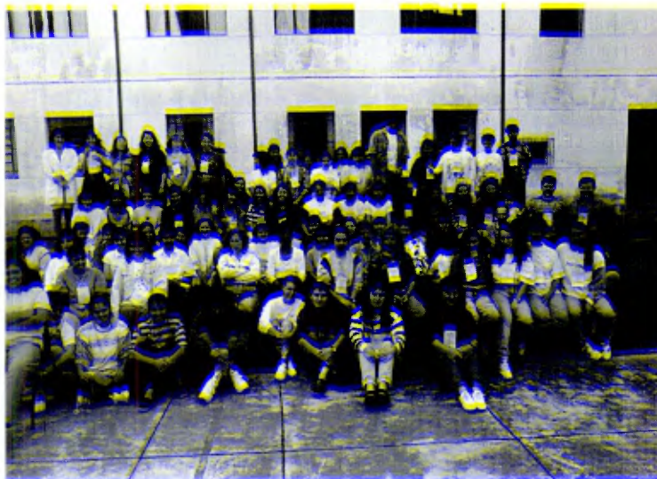
Profesores del Distrito de São Paulo durante un Curso en Conceição da Aparecida, MG, 3-7 de abril de 1995.