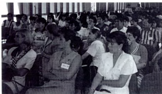
México Sur: Encuentro de Familia Lasallista en Veracruz.

La formación de los padres de familia es importante cuando quieren integrarse en la Familia Lasallista y Compartir la Misión.