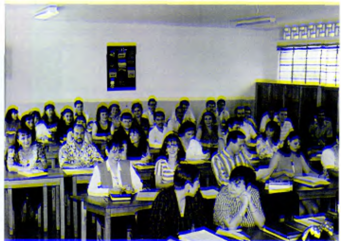
Bucaramanga, Distrito de Bogotá: Los profesores en Jornadas de Espiritualidad Lasallista.

El D.E.F. (Departamento de Educación en la Fe) intenta ser el eje de la acción pastoral en cada institución lasallista. Integrado por los responsables de la catequesis, de las vivencias sacramentales y de la acción pastoral dentro y fuera del centro escolar, mantienen su espíritu cristiano lasallista en torno a un Proyecto de Nueva Evangelización, de acuerdo con las orientaciones de la Iglesia hoy.