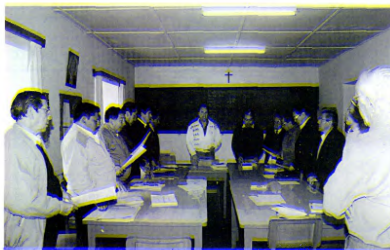
Perú, 4 de julio de 1995: Participantes en la reunión de Subdirectores y Jefes de Departamento de los centros del Distrito.