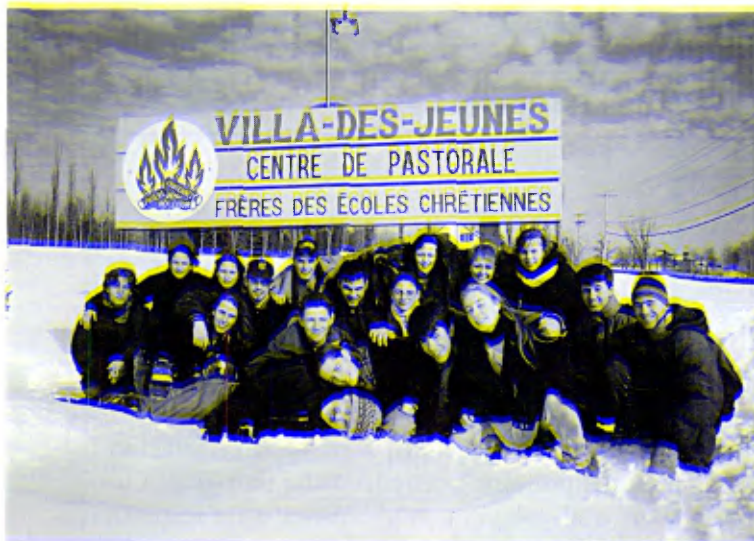
Canadá, Villa-des-Jeunes: Grupo de jóvenes participantes en una sesión