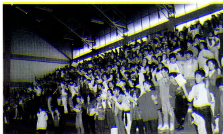
Distrito de Perú, Arequipa: Jóvenes Lasallistas en la vigilia de Pentecostés.