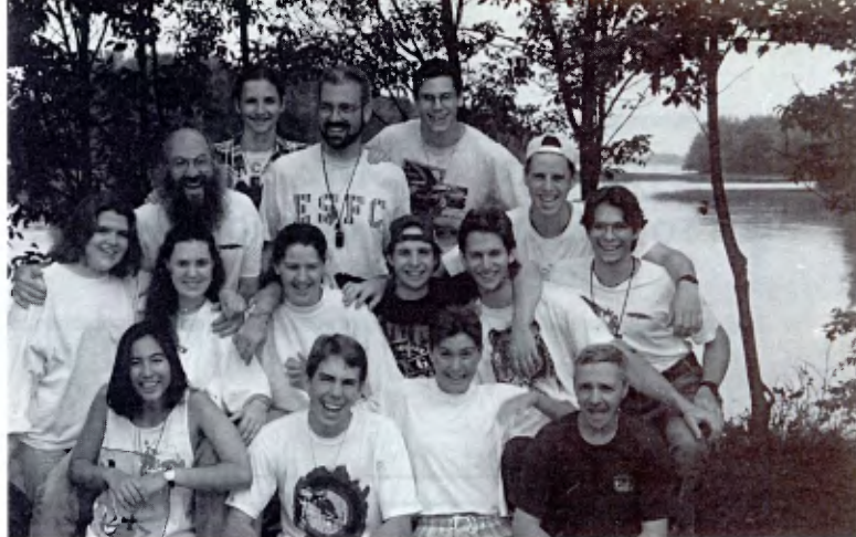
Canadá, Camp de l'Avenir: un grupo de jóvenes y los animadores del Centro

Los frutos logrados no provienen de personas aisladas, sino del equipo que se ha constituido poco a poco, en el cual se comparte realmente la misión de forma muy concreta. Hermanos y jóvenes laicos están comprometidos por igual en la organización y en el funcionamiento.