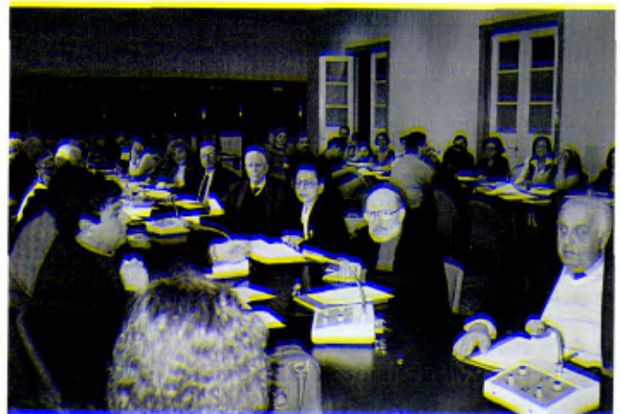
Seminario de la Familia Lasaliana de la Región Italia para estudiar la organización del Voluntariado Lasaliano. Roma, Casa Generalicia, 11-12 de febrero de 1995.

Son periodos vividos intensamente, que le hacen a uno consciente de los talentos que otorga el Señor. Son vacaciones, al estilo del Espíritu, en las que no hay diferencia entre asistidos y acompañantes, pues se busca crear un clima de familia y de fraternidad.