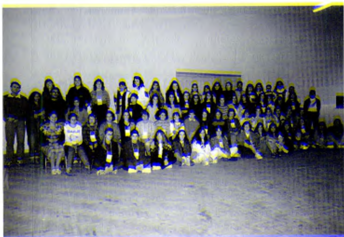
Distrito de São Paulo, Centro La Salle de São Carlos: Participantes en un Curso de Profesores.