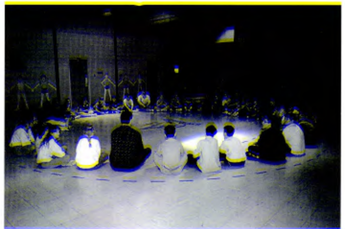
Canadá, Villa-des-Jeunes: Un momento de encuentro y convivencia.

Uno de estos seglares ha participado con los Hermanos en el retiro de 1995, experiencia de la que ha quedado muy contento. En julio de 1996, ambos participarán en la sesión del Centro Lasaliano Francés.