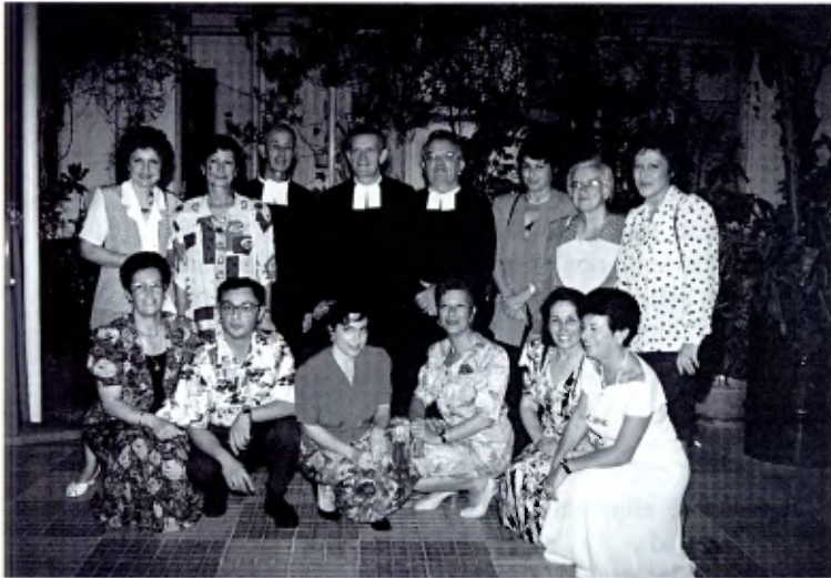
Grupo Signum Fidei de Malta.

Las reuniones de los miembros de cada grupo suelen ser quincenales, con momentos de convivencia, reflexión y oración.