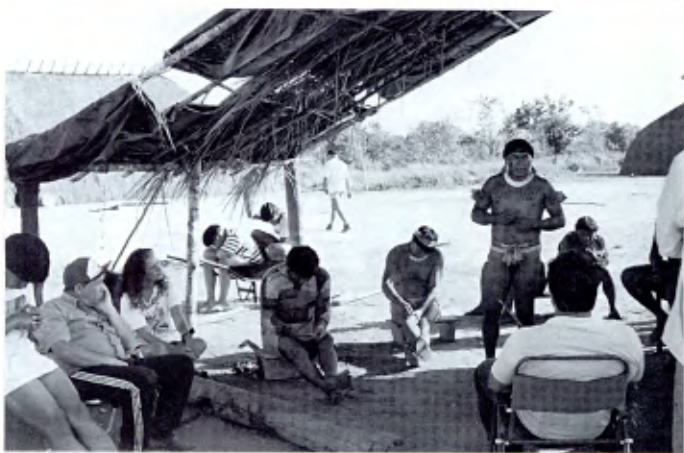
Misión indios Kalapalo: reunión de "caciques" con los lasallistas para discutir la educación en la aldea.

Tanto los profesores del Centro São Carlos como los indios Kalapalo están muy ilusionados con este proyecto.