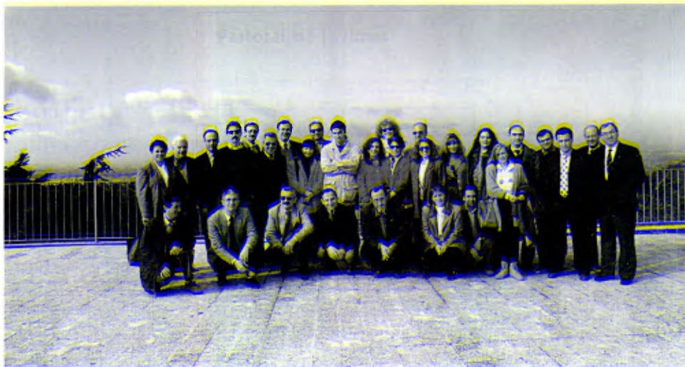
Distrito de Roma: Participantes en un grupo del CELAS.