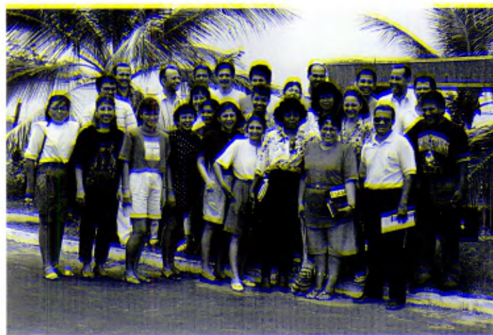
Distrito de Centroamérica: Profesores del Grupo de Formación de Cartagena.