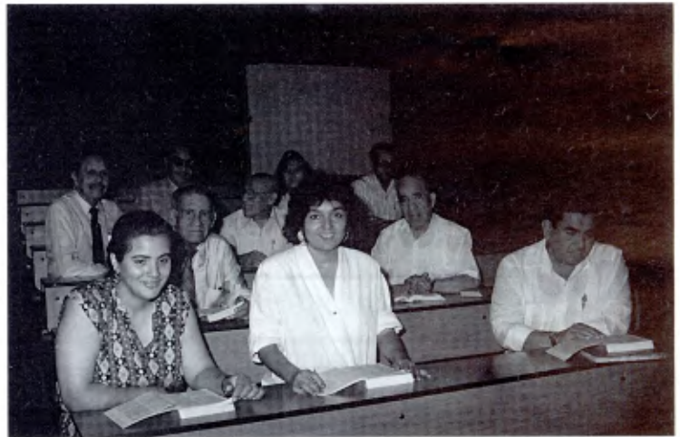
Guayaquil, Ecuador: Miembros del Grupo Signum Fidei en una de sus reuniones habituales.