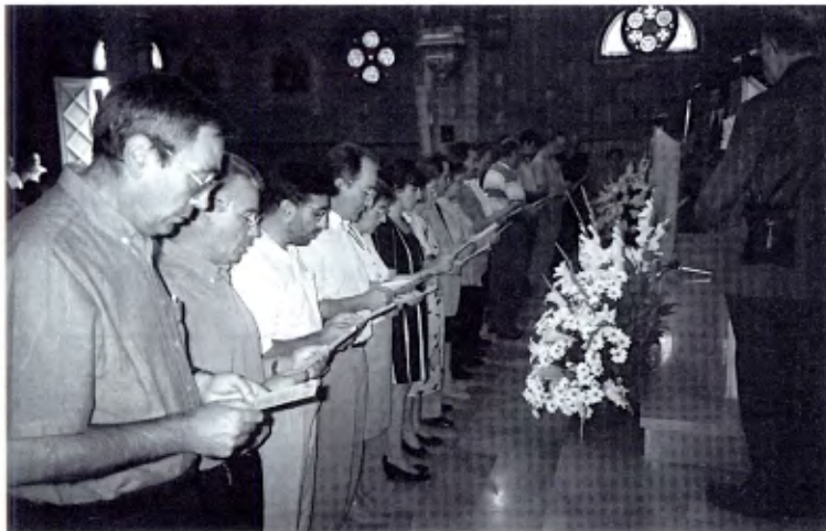
Barcelona, 4 de septiembre de 1994: Miembros "Signum Fidei" del Distrito de Cataluña renovando su consagración.