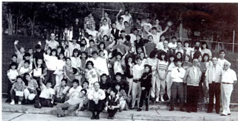
Distrito de Caracas: El Hno. Superior General con el grupo Juvenil La Salle, en Mérida.