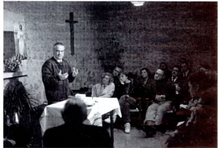
Distrito e Valencia-Palma: Un encuentro de Hermanos y Padres de Alumnos para promover Comunidades Cristianas Lasalianas

Cada año el tema de reflexión se centra en un asunto relativo a la Misión Compartida.