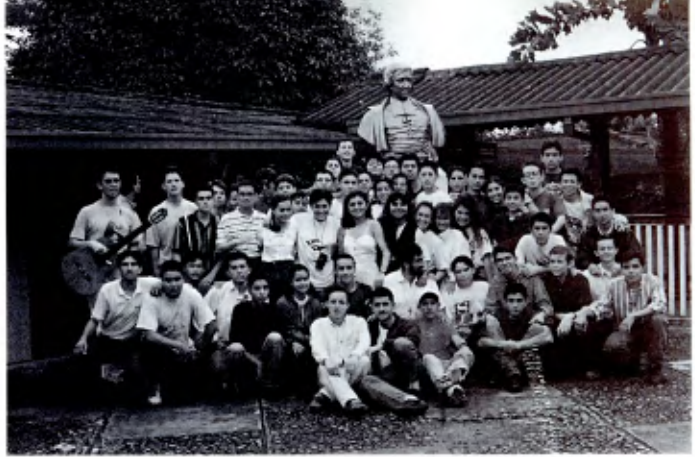
Participantes en uno de los Cursos para Catequistas. Hermanos y jóvenes animadores de la Fe en los Colegios se reúnen durante 10 días en un lugar especial para adquirir la formación necesaria para profundizar y asimilar la Espiritualidad de La Salle y adquirir elementos pedagógicos para dirigir la Catequesis en sus lugares de apostolado.

Bajo la orientación de la Vice-Rectoría de Promoción y Desarrollo Humano de la Universidad De La Salle, se llevan a cabo semestralmente; estos encuentros que pretenden formar a los muchachos que lideran la Pastoral en la Universidad.