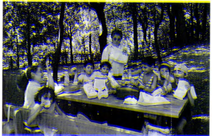
Génova: un momento de descanso y de solaz.

Así, pues, en la obra están comprometidos los Hermanos, los miembros Signum Fidei y los Voluntarios Lasalianos. Se puede contar con la colaboración de jóvenes del Servicio Civil, con la adecuada formación y disponibilidad.