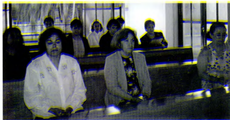
Distrito de México Sur: Comunidad de Oración San Benildo del Kinder La Salle, en la capilla de las Hermanas Guadalupanas de La Salle.