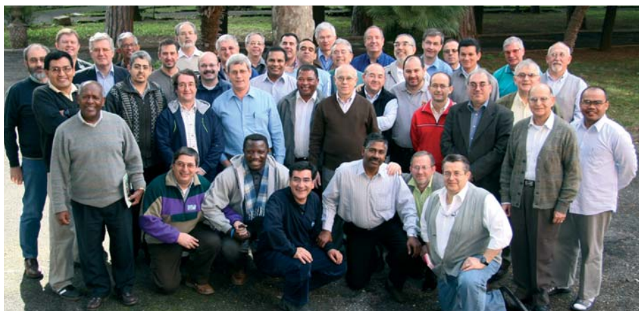
Groupe des participants au CIL 2006-07 (« Charisme au milieu de la vie »), avec le Conseil Général et les membres de l'équipe d'animation.