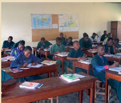
2938 Talba (Cameroun)