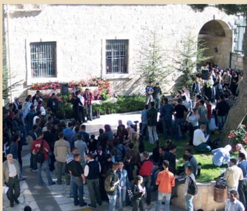
2945 Université de Bethléhem (Palestine)