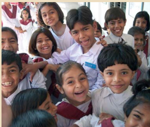
2962 Faisalabad (Pakistan)