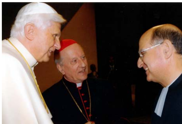
F. Álvaro Rodríguez salue S.S. Benoît XVI, en présence de M gr . Franc Rodé, Préfet de la Congrégation des Religieux

Les personnes consacrées sont appelées à être dans le monde le signe crédible et lumineux de l'Évangile