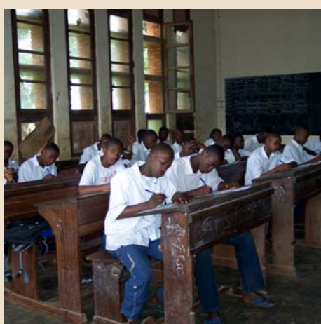
2862 Tumba (Congo)