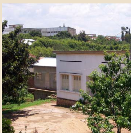
2829 Antsirabe (Madagascar)