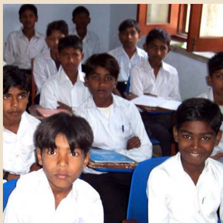
2756 Khushpur (Pakistan)