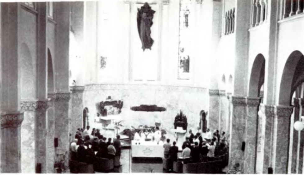
El «Punto d'Incontro» de nuestra Comunidad, ante el Señor, en nuestra liturgia comunitaria.

Este es el Punto de Encuentro de la Comunidad: El Santuario de San Juan Bta de La Salle de la Casa Generalicia de los Hermanos.