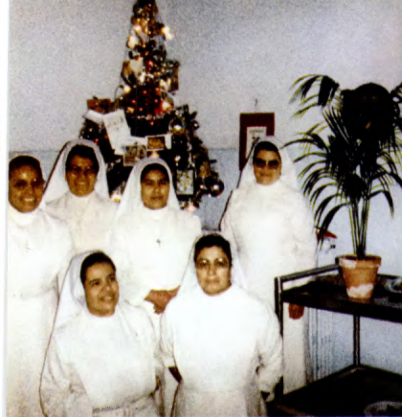
La comunidad de las Hermanas Lasalianas Guadalupanas de la Casa Generalicia