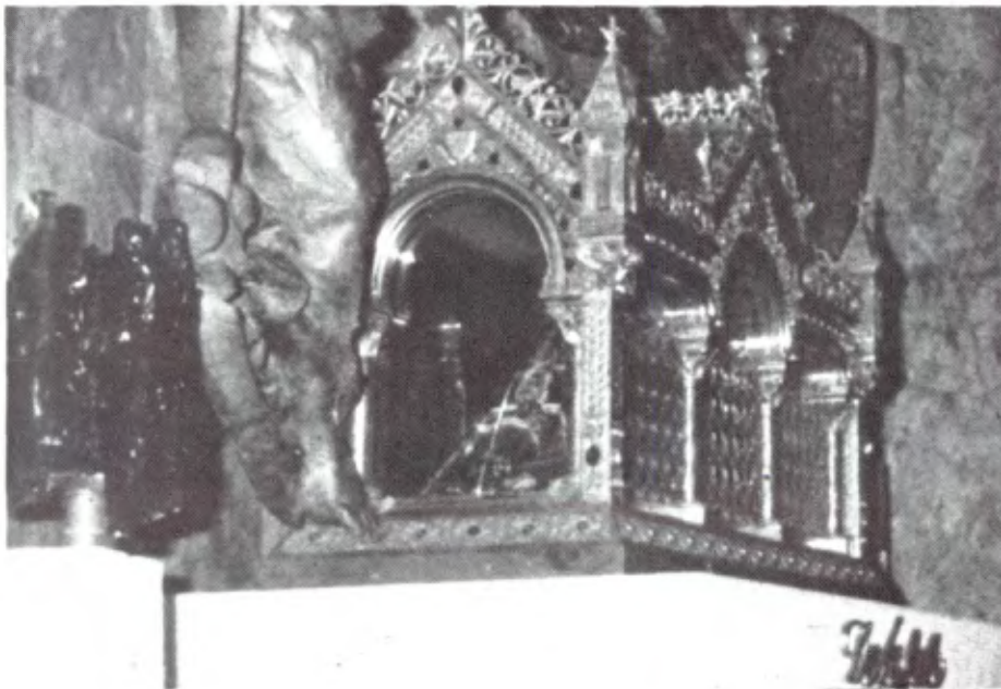
El Relicario del Santo, corazón del Instituto.

Parece que los Hermanos que nos visitan, quedan gratamente impresionados por nuestras liturgias, que, sin tener nada extraordinario, quieren ser significativas.