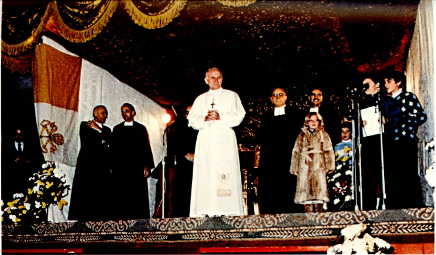
Recuerdo imborrable de la visita del Papa a la Escuela.