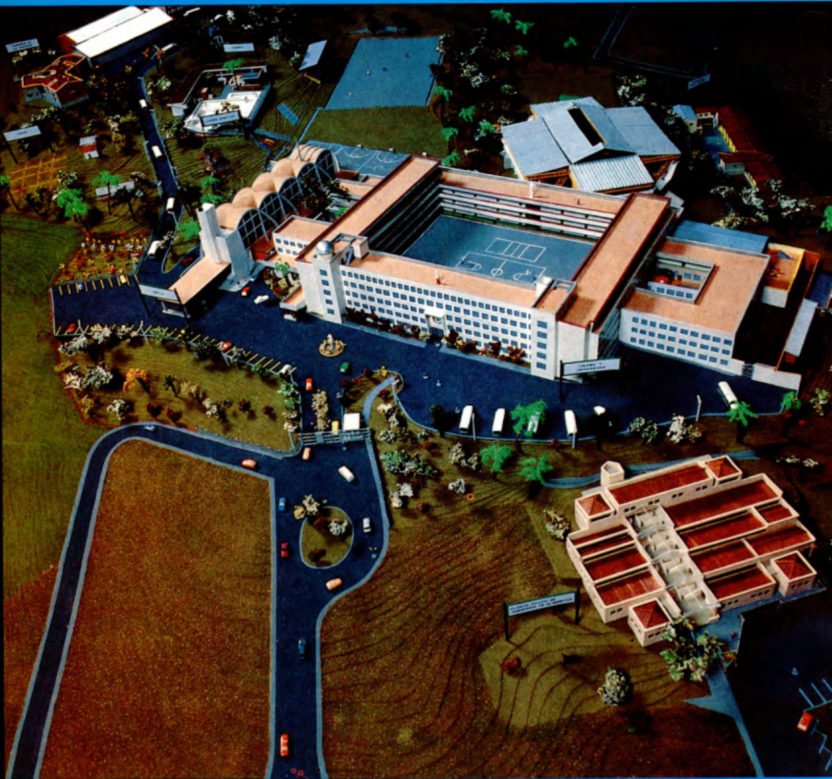
Corporation Universitaire Lasallienne de Medellin (Colombie): maquette du complexe éducatif.