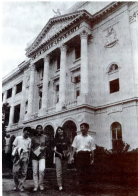
Etudiants de l'Université de La Salle de Manille.