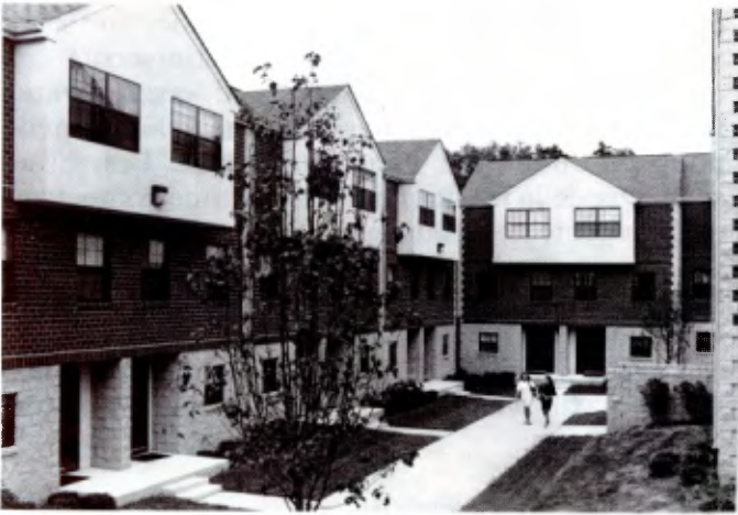
Venant de 30 Etats nord-américains et de 40 pays étrangers, 1.741 étudiants et étudiantes résident sur le campus de La Salle University, beaucoup d'entre eux dans des logements modernes comme ceux-ci à St. Miguel Court.

fants dont la mère travaille, et le projet Appalachia: des étudiants passent volontairement leur vacances de printemps à réparer ou rénover des maisons, ou à travailler à la ferme dans des régions économiquement faibles de l'est des Etats-Unis.