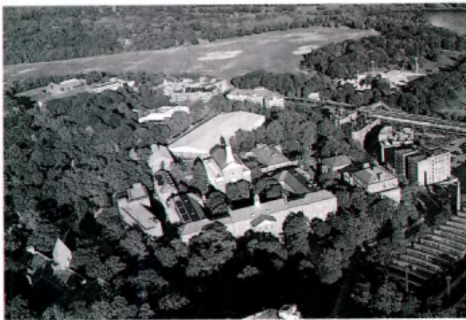
Vue aérienne des bâtiments de Manhattan Collège (New York).