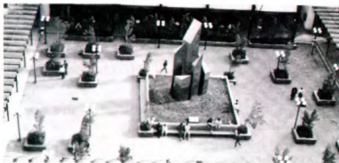
A l'Université La Salle de Mexico.

— 19 août 1991: Début des activités scolaires.