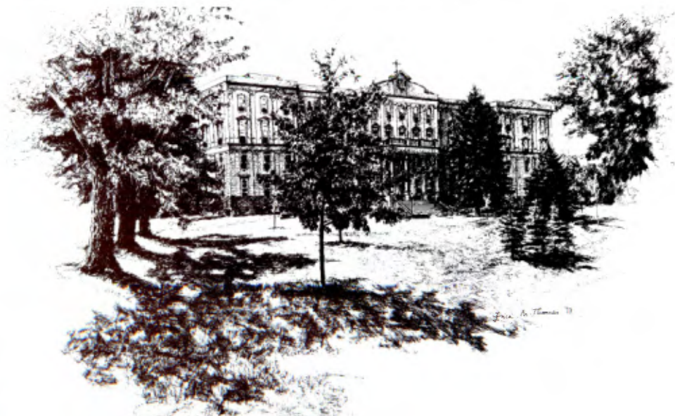
Winona (Minnesota, USA): Saint Mary's College, la façade.

En 1990, Saint Mary's College de Minnesota fit partie d'un groupe d'institutions honorées par la Fondation John Templeton pour le développement du caractère moral des étudiants. Le tableau d'honneur de cette Fondation relevait 102 des 1 465 institutions d'enseignement supérieur dans sa liste la plus récente.