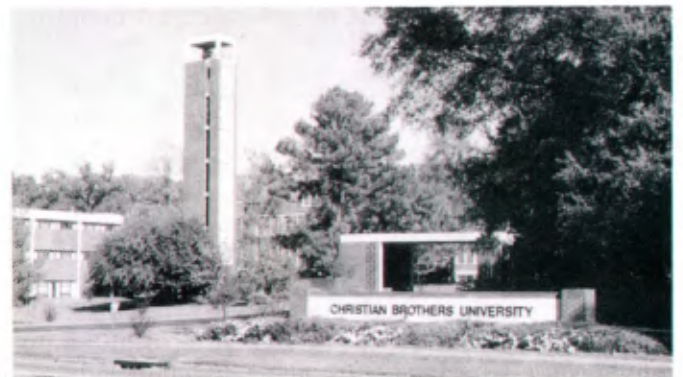
Memphis (Tennessee, USA): Christian Brothers University, l'entrée.