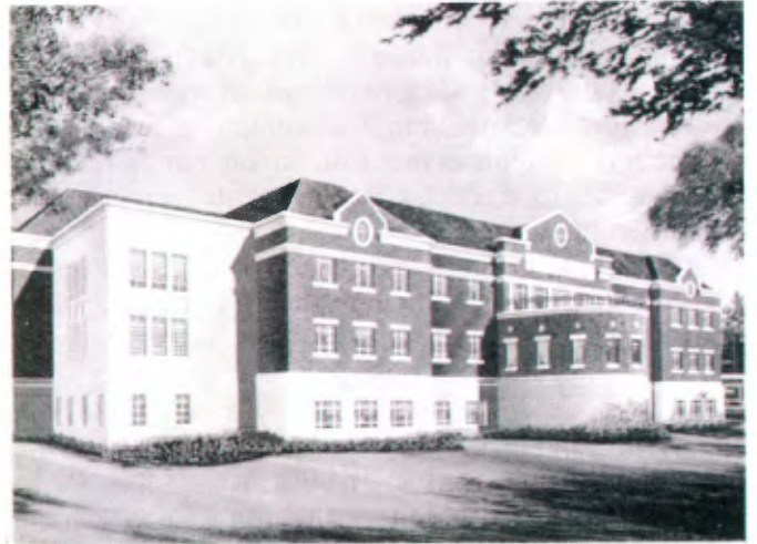
Memphis (Tennessee, USA): Christian Brothers University, Ecole des Affaires et des Télécommunications.