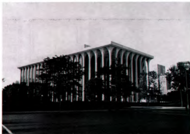
Santa Fe (Nouveau Mexique, USA): la bibliothèque du Collège.

Deux prêtres demeurent sur le campus. Un d'entre eux remplit l'office d'aumônier et l'autre dessert la communauté des Frères. Au total 21 Frères des Ecoles Chrétiennes travaillent au «College» ou sont en retraite sur le campus. Le «College» est dirigé par un Conseil d'administration formé de Frères et de laïcs. Le «College» a recueilli 7 millions de dollars récemment en vue de s'étendre. Il compte plus de 4 000 anciens élèves diplômés répandus dans tous les Etats-Unis et dans plusieurs pays étrangers.