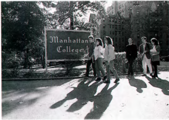
Entrée de Manhattan Collège (New York).