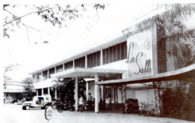
Bacolod City (Philippines): Collège de La Salle, la façade.

Bien conscient que les Philippines sont une nation en croissance, le «College» assure une éducation qui explore le royaume de la connaissance et sensibilise les étudiants aux besoins du pays. Dans ce but, il cherche à former des professionnels qui seront engagés dans les programmes de développement sur les plans local et national.