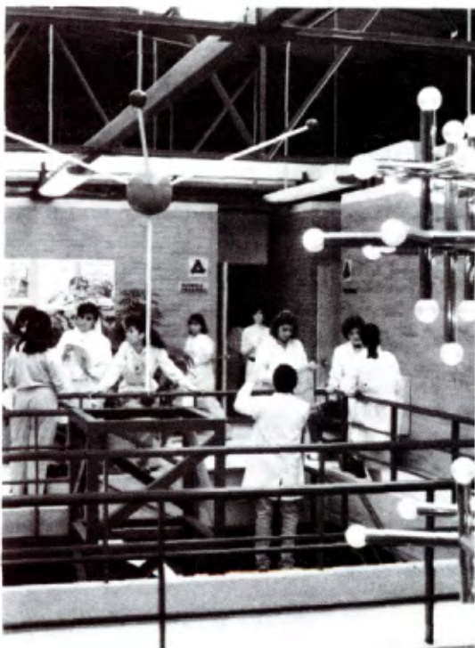
A l'Université La Salle de Mexico.

Le corps professoral de l'Université rassemble 420 professeurs: 70% d'entre eux possèdent une Licence, 20% une Maîtrise, 7% un Doctorat et 3% sont des stagiaires.