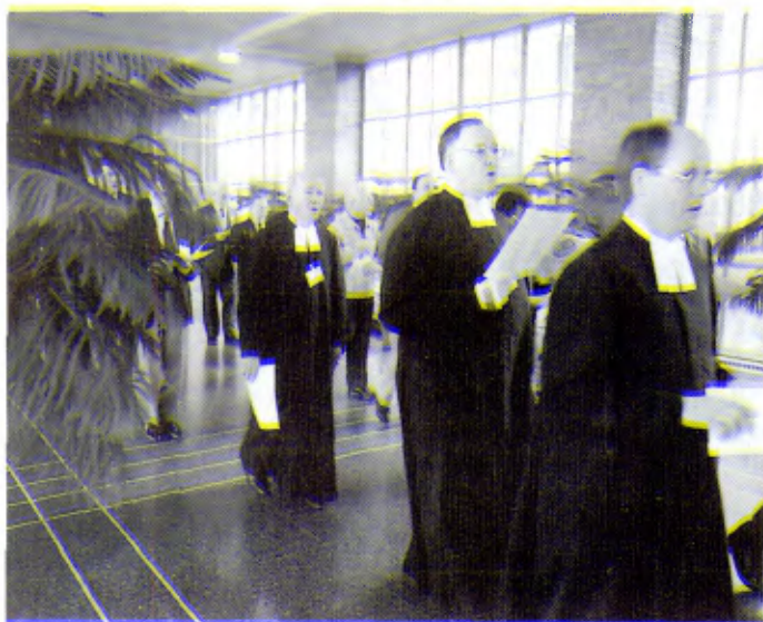
Otra vista de la procesión hacia la capilla para celebrar la misa inaugural del 42º Capítulo General.

de marginación y separación social. En esos grupos proyecta la sociedad sus más ocultas esperanzas, sueños y aspiraciones.