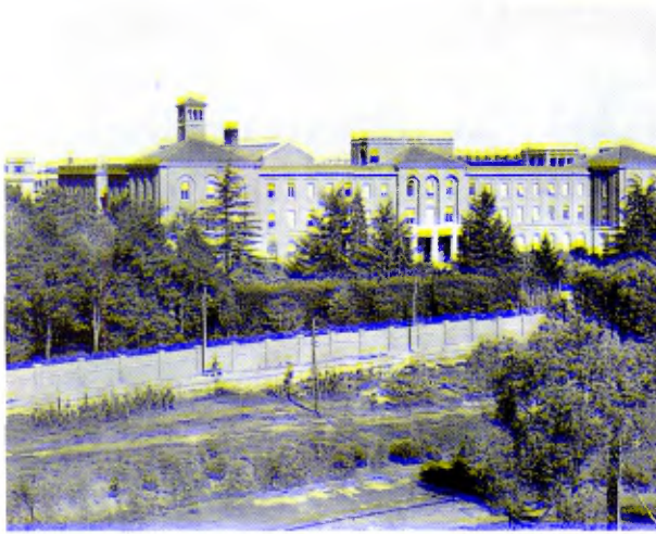
La Casa Generalicia, en Roma, sede del 42º Capítulo General.