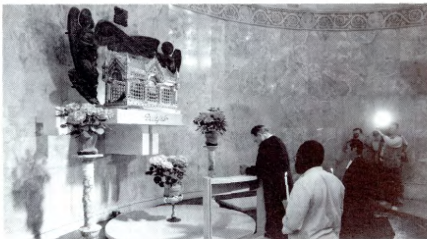
El H. Superior ante las reliquias del Santo Fundador.

A ellos y a todos y cada uno de los moradores y trabajadores de la Casa, los Delegados al Capítulo General expresan efusivamente su gratitud.