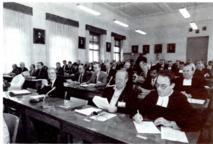
Dos ángulos de la sala Capitular: sonrientes o serios, pero siempre inmersos en el trabajo.