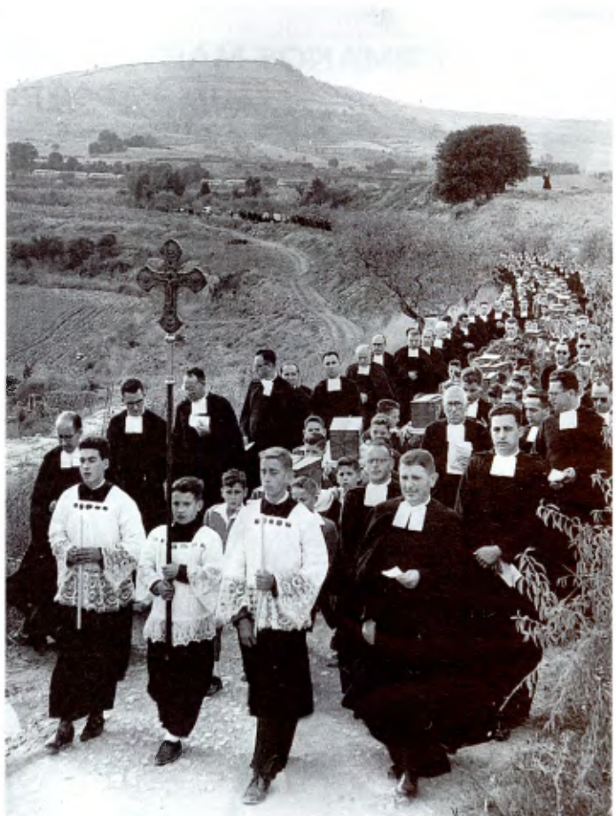
Los novicios Menores tuvieron el honor de transportar a hombros las urnas con los restos mortales, desde la carretera hasta la Casa de San Martín de Sasgayolas.