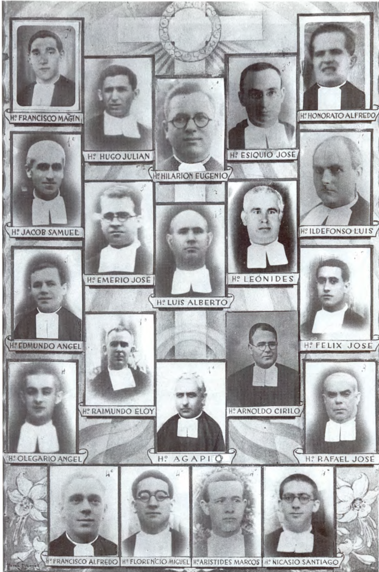
Primera fila, 1 Hermano de Sampedor, tres de Gerona, 1 de San Hipólito de V. Segunda fila: 1 de La Seo, 1 de Gerona, H. Director de Alcora, 1 de Sta. Coloma, 1 de Horta. Tercera fila, en los extremos, uno de Salt y 1 de Monistrol. Cuarta fila: 1 de San Hipólito, 1 de Sampedor, H. Director de S. Hipólito, Dr. del N. M. de Mollerusa, 1 de San Feliu de Guixols. Ultima fila: Hnos. de Palamós, Berga, San Feliu y Mollerusa.