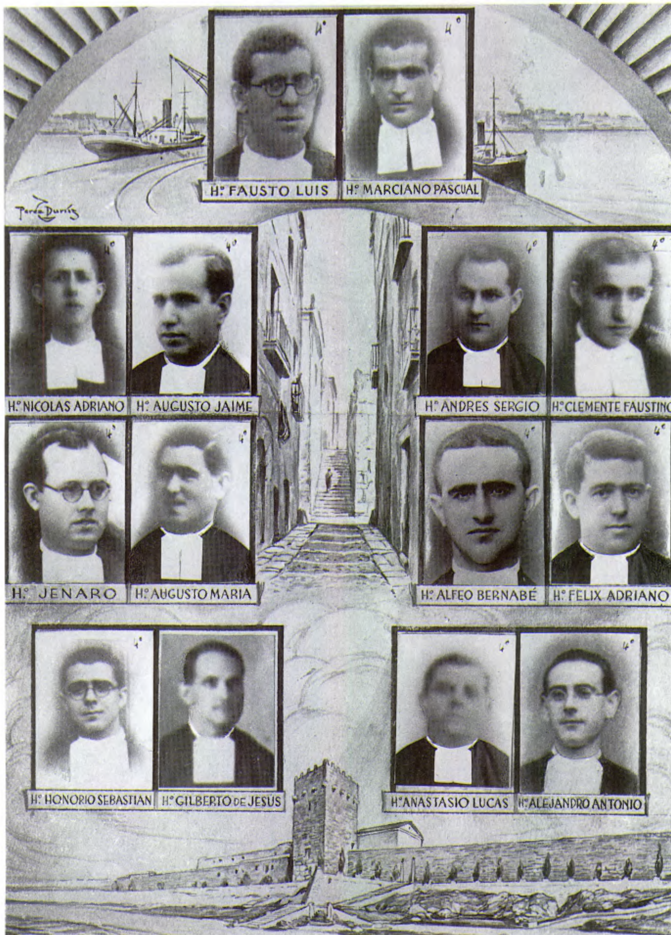
Hermanos de Tarragona.