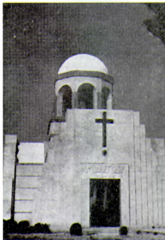
Valdepeñas. Monumento en el cementerio en honor de los mártires enterrados en la localidad.