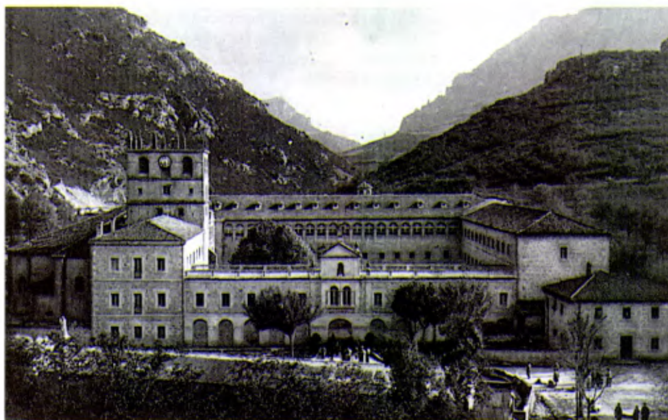
Bujedo, Casa donde se formaron numerosos Hermanos mártires de España. Foto de los años 40.