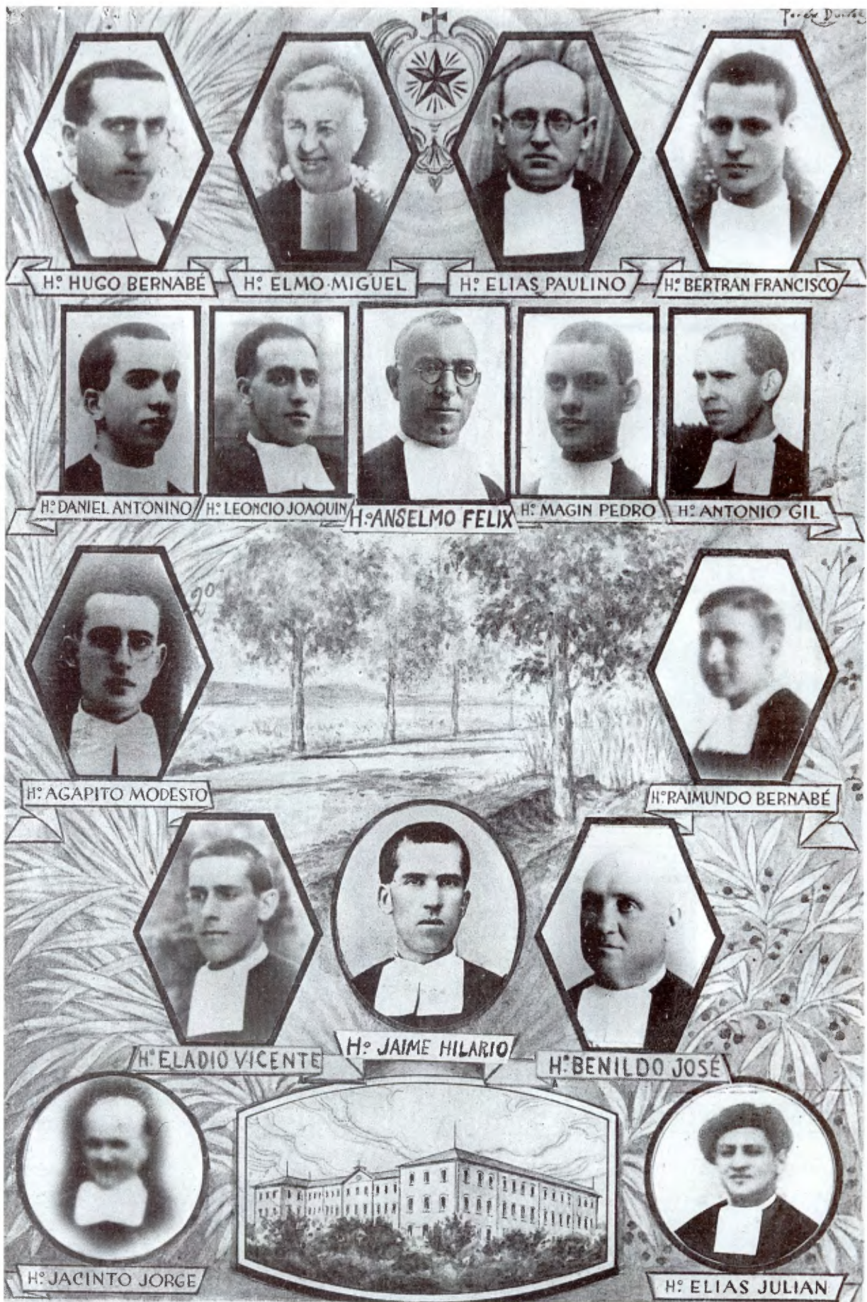
Hermanos de Cambrils.