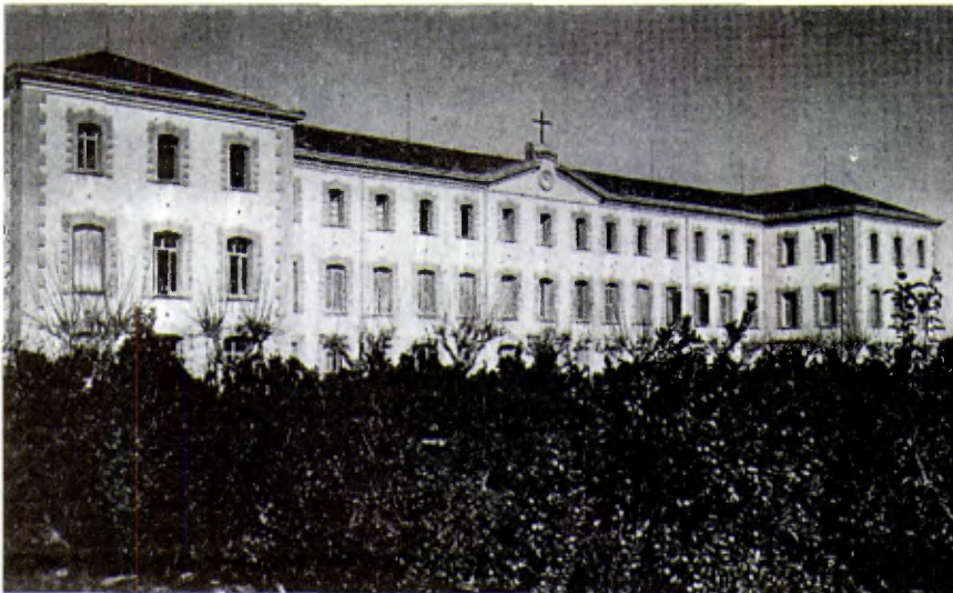
Cambrils (Tarragona), Casa San José.

Hacia las 6 de la tarde del mismo día 22 los tres Hermanos fueron asesinados en una barriada de Valencia, en una escombrera de la calle Sagunto.