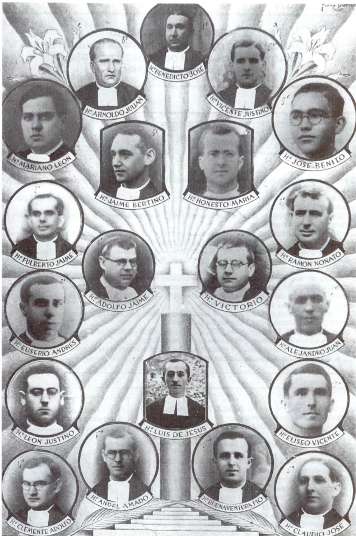
Primera fila: 5 Hermanos de Moncada. Segunda fila: 2 Hnos. de Manresa. Tercera fila: 3 de Manlleu y 1 de Ntra. Sra. del Carmen. Cuarta fila: 1 de Manresa, 1 de Josepets, 1 de Ntra. Sra. del Carmen. Quinta fila: 4 Hermanos de Tortosa.