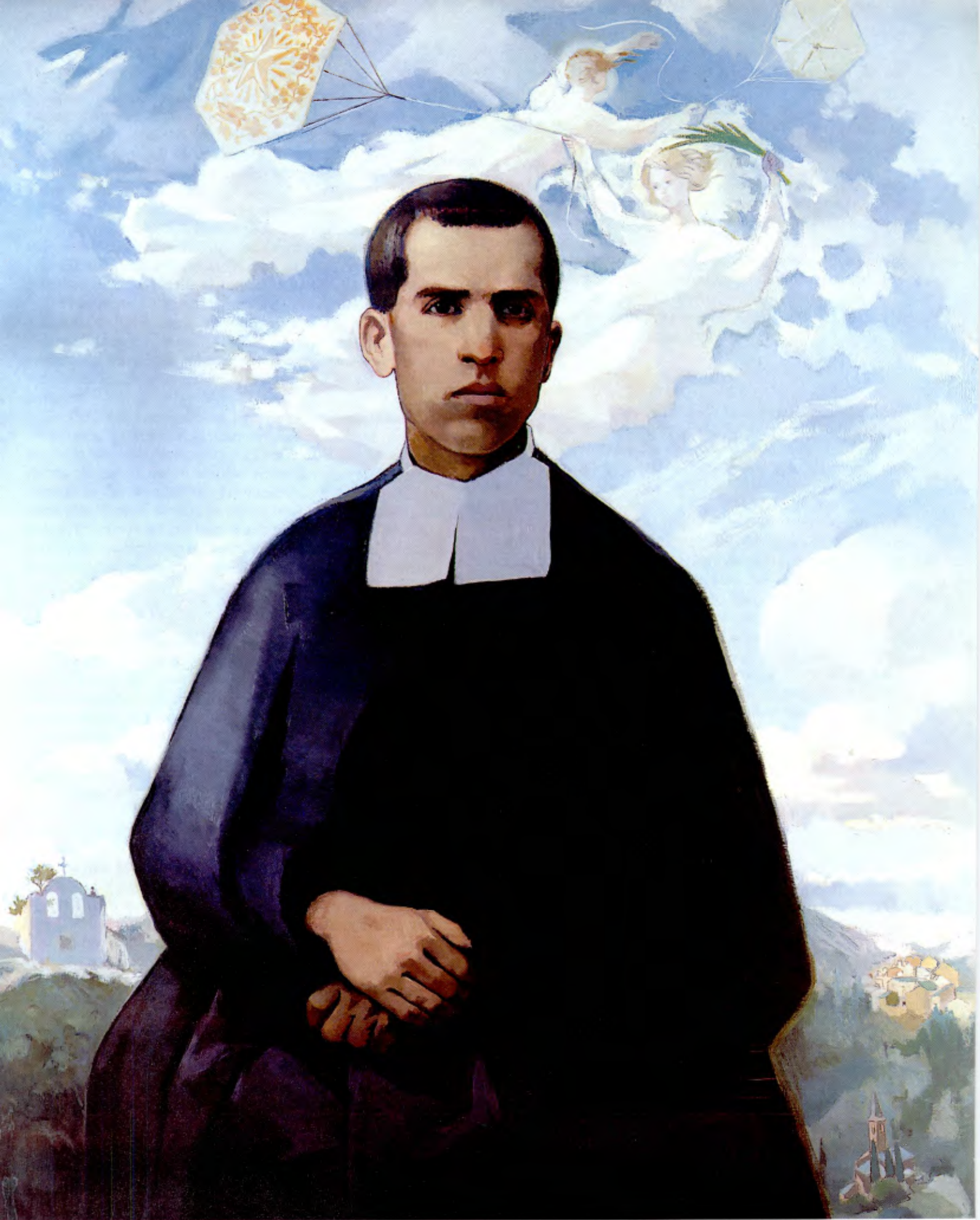
Beato Hermano Jaime Hilario Barbal