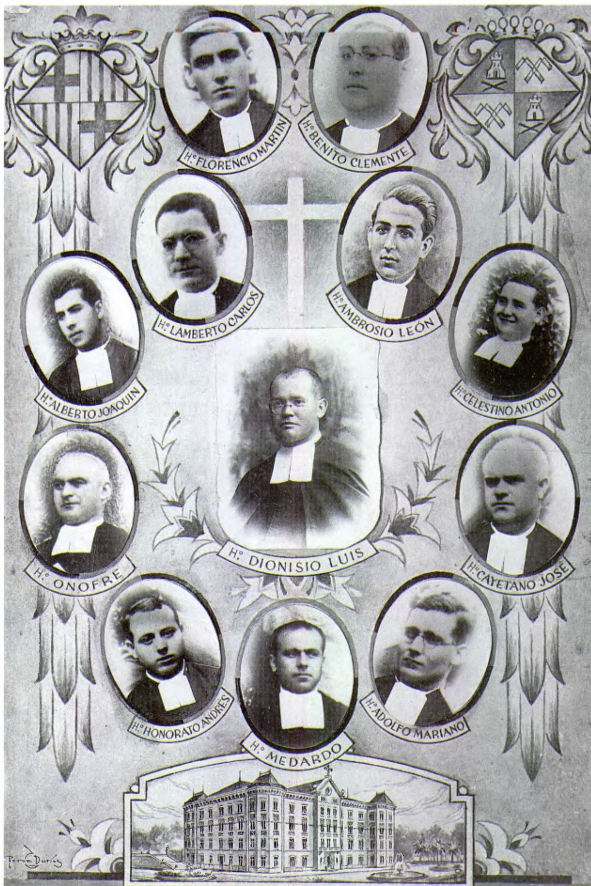
Hermanos del Colegio Nuestra Señora de la Bonanova, de Barcelona.