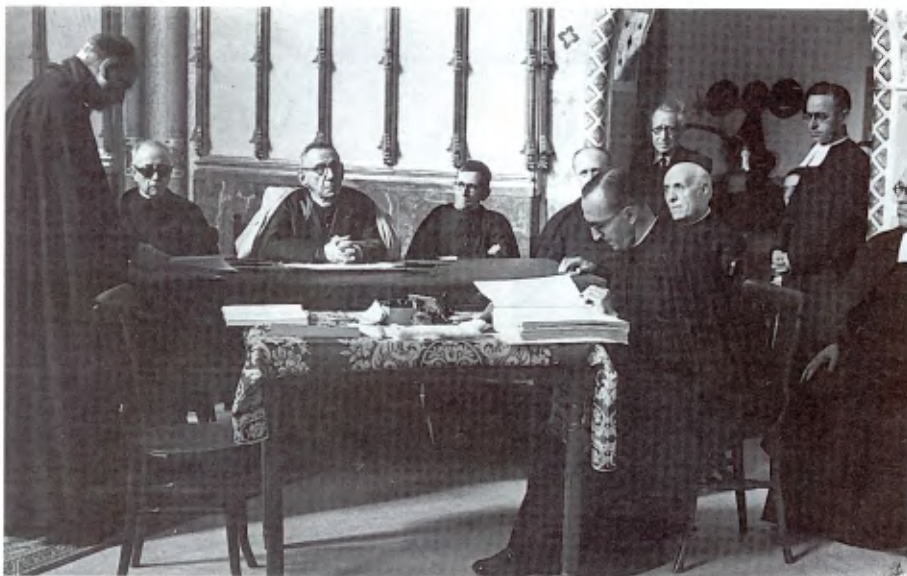
Barcelona: acto de clausura del proceso diocesano para la Causa de Beatificación de los Hermanos de Barcelona.