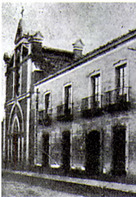
Santa Cruz de Mudela. Casa - comunidad de los Hermanos, donde fueron apresados el 21 de julio de 1936.

Detenido con los otros cuatro Hermanos de la comunidad el 22 de julio, fue asesinado el 19 de agosto en Valdepeñas con los Hermanos, con cinco sacerdotes y otros 20 seglares muy relevantes por sus convicciones religiosas. Tenía 20 años.