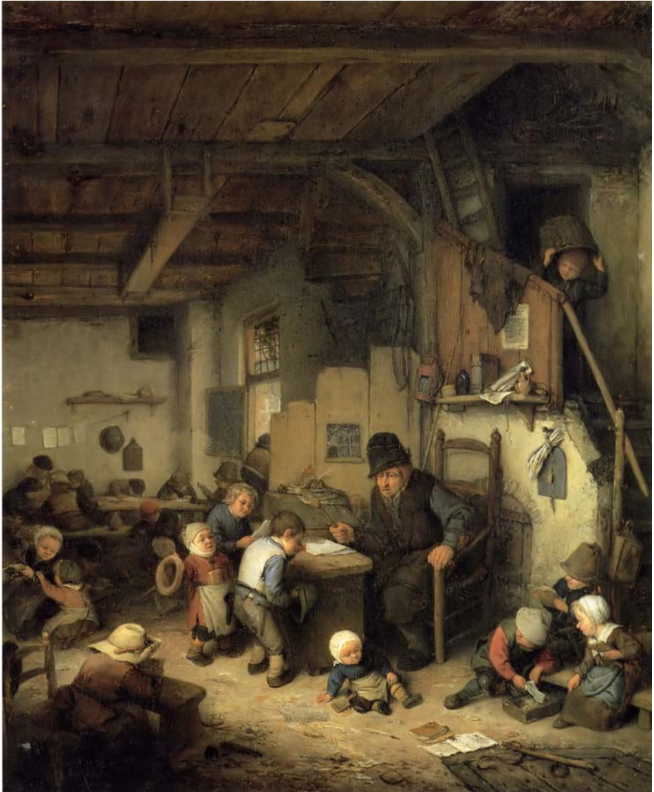
Adriaen Van Ostade, le Maître d'école. Musée du Louvres. Paris.